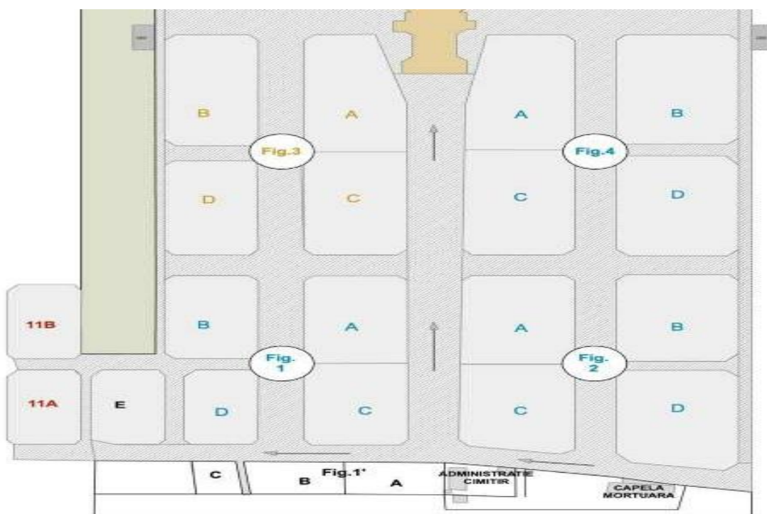
Fig. .... Parcela .... Randul .... Locul .....